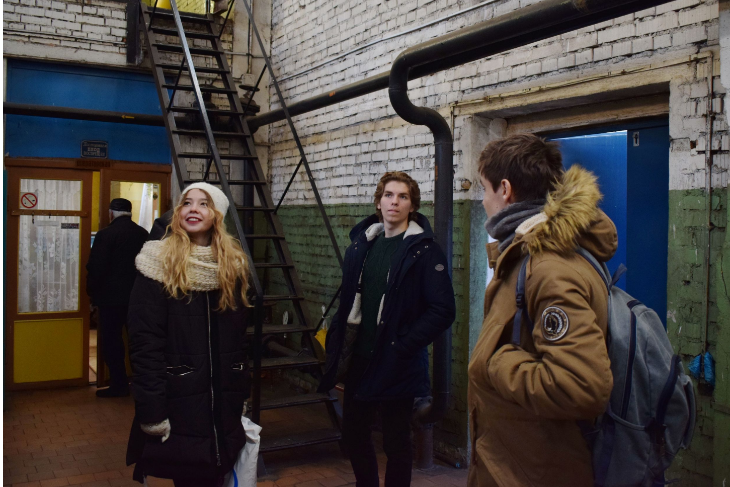
Дирекция тепличного комбината Агрофирмы "Победа"