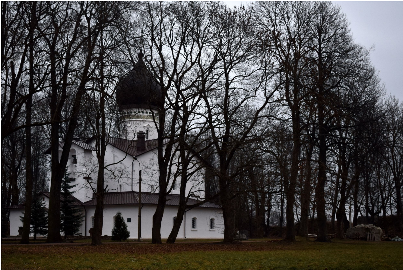
Гдовская крепость - Свято-Державный Дмитриевский собор.