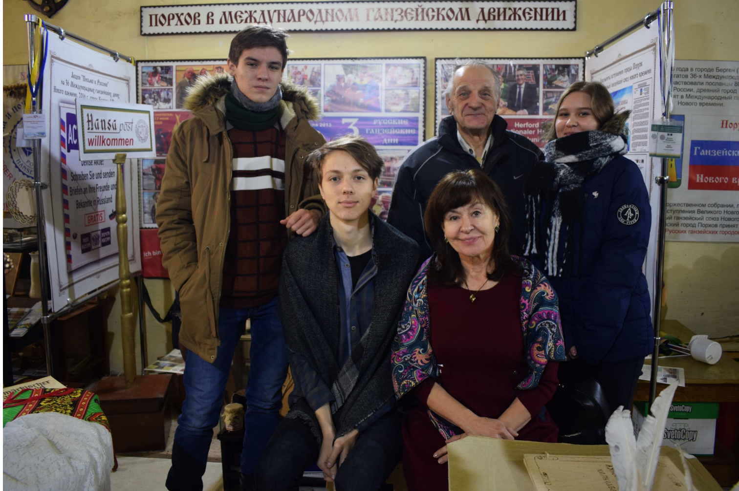
Музей Ганзейской почты